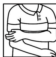
Massaggiare delicatamente per favorire l'assorbimento.